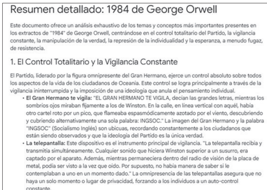
Figura 3. Fragmento - resumen de “1984”.

Otro ejemplo en esta fase, si se desea profundizar a detalle en la obra, es la generación de un resumen. La Figura 3 presenta solo un fragmento de la obra “1984”. La versión en extenso describe los aspectos principales de esta distopía: el control totalitario y la vigilancia extrema ejercidos por el partido (“El gran hermano te vigila”), la manipulación de la verdad, la realidad y la historia, la represión de la individualidad y de las relaciones humanas, la naturaleza del poder y la tortura. La IAG favorece la identificación de elementos importantes sobre la crisis radical que sufre la dignidad humana y la dimensión relacional del ser humano en el descenso a todos los niveles de vértigo.