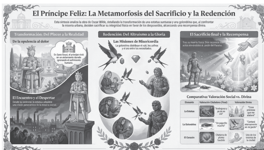
Figura 2. Infografía de “El Príncipe Feliz” 85 .

etapa de “el encuentro y el despertar”, ocurre un encuentro genuino entre el Príncipe y la golondrina, quien también saldrá de su egoísmo para colaborar con el Príncipe en las “misiones de misericordia” como actos de donación de ambos personajes (Niveles 2 y 3 del encuentro y los valores). La última etapa refiere el “El sacrificio y la recompensa”. Se han donado al extremo movidos por la generosidad. El corazón de plomo del Príncipe y el cuerpo sin vida de la golondrina son despreciados por las autoridades como desechos materiales inútiles, no obstante, se convierten en lo máspreciado en el cielo gracias a sus obras (pauta para desarrollar el Nivel 4 en la relación trascendental con Dios).